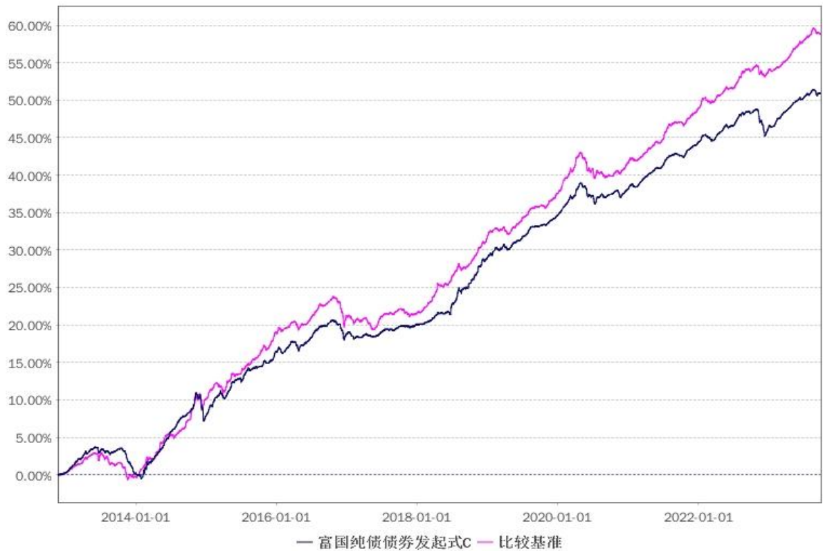
较基准收益率的历史走势对比图